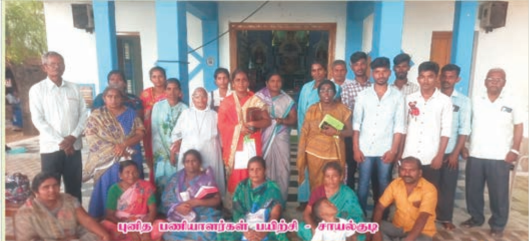
முனித பணியாளர்கள் பயிற்சி - சாயல்குடி