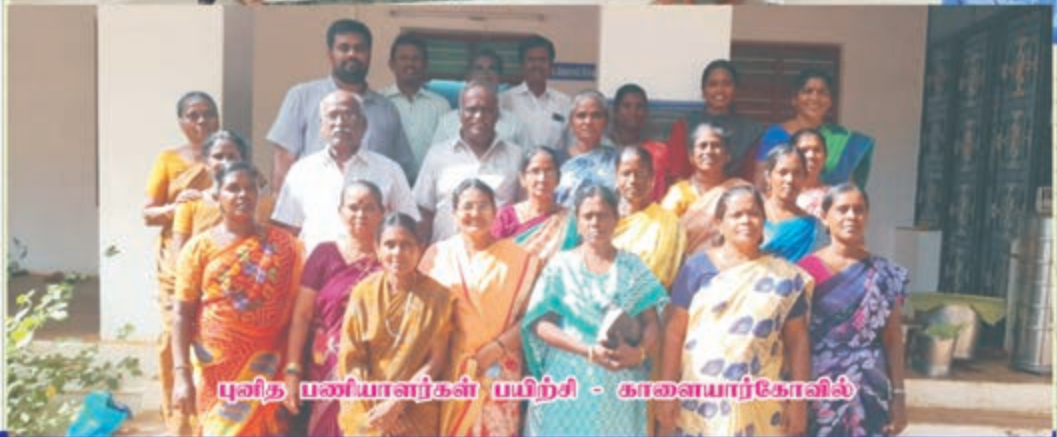
முனித பணியாளர்கள் பயிற்சி - காணையாரகோவில்

படங்களைத் தொண்டு திறைப்படுத்தையை கண்டுபிடிப்பதற்கு?