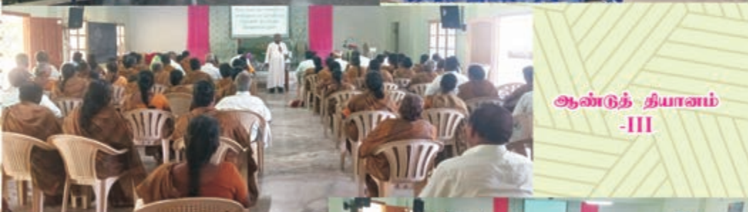
ஆண்டுத் தியானம் -III