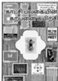
காட்சி பலகையின் கருப்பனைபயிற்சி

கடந்த மாதத்தில் நமது இலக்குகளை அடைய நேர்மறையான உறுதிமொழிகளை எழுதி அதை ஒவ்வொரு சூழலுக்கு ஏற்ற வண்ணம் சொல்லிக் கொள்வது பற்றி பார்த்தோம். அதை தொடர்ந்து சில உறுதிமொழிகளை பார்ப்போம்.