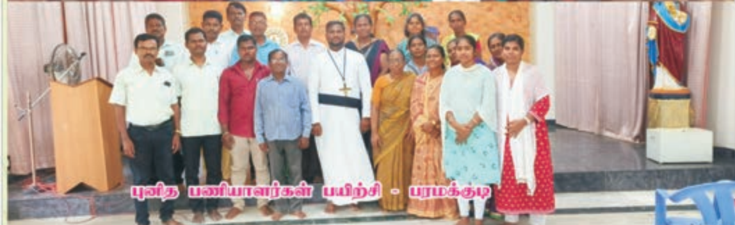
முனித பணியாளர்கள் பயிற்சி - புரமக்குடி