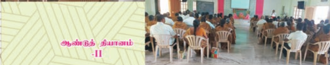
ஆண்டுத் தியானம் -II