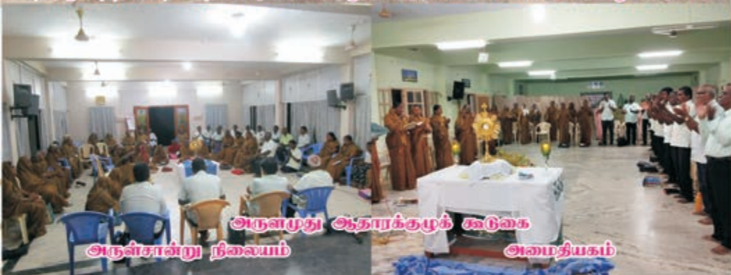
அருளமுது ஆதாரக்ருபுக் கூடுகை அருள்சான்று நிலையம் அமைதியகம்