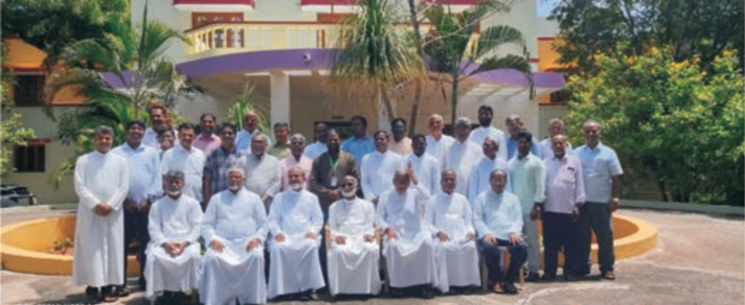
தமிழக நற்சமீத அறிவியல் பணிக்ருபு செயலர்கள் கூட்டம் - எம்மாயுஸ் மையம்