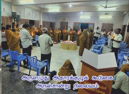
அருளமுது ஆதாரக்குழுக் கூடுகை அருள்சான்று நிலையம்