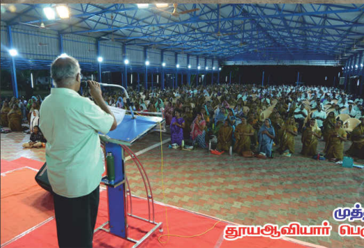
முத்திரை தூயஆவியார் பெருவிழா திருவிழிப்பு