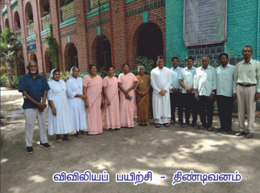
விவிலியப் பயிற்சி - திண்டிவனம்